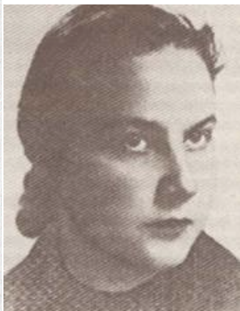
Rajka Baković je 24. jula 1953. godine proglašena narodnim herojem SFR Jugoslavije.