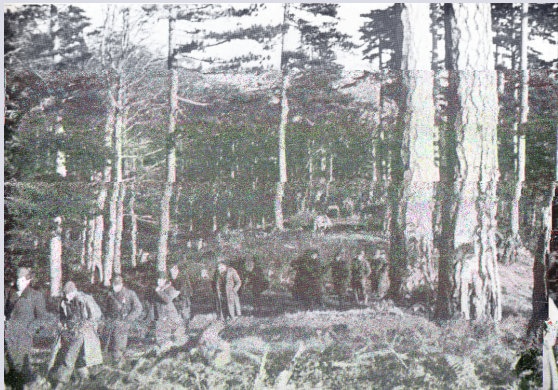
Drago Mazar, Partizanski album, 4 jul, Beograd 1981